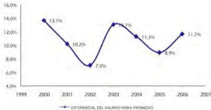
Abbildung 9: "Unterschiede im durchschnittlichen Stundenlohn zwischen Männern und Frauen", Bernat Díaz 2009: 29).

Die größten Unterschiede im Einkommen fanden sich bei den geringer gebildeten Personen, die Teilzeitarbeit nachgingen, im Haushalt und in kleinen Unternehmen angestellt waren (Hoyos et al. 2010: 27 f.). In Bezug auf das Wohlbefinden ist festzustellen, dass Frauen mit einem niedrigen Bildungsabschluss am ehesten unter Diskriminierung leiden, obwohl aus ökonomischer Perspektive Frauen mit einem Universitätsabschluss proportional deutlich stärker von Einkommensdiskriminierung betroffen sind (Bernat-Díaz 2009: 208).